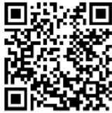
TABLO 6C Mesleki ve Teknik Ortaöğretim Kurumu Mezunlarının Ek Puanları ile Yerleşebilecekleri Ön Lisans Programları

İlgili Yükseköğretime Geçiş Kılavuzlarında da mesleki ve teknik ortaöğretim kurumlarının tabloda belirtilen alan/dallarından mezun olanlar yine tabloda gösterilen yükseköğretim ön lisans programlarına yerleştirilirken, yerleştirme puanları OBP'nin 0,12 ile çarpılması ve puanlarına eklenmesi suretiyle yerleştirme yapılmaktadır.